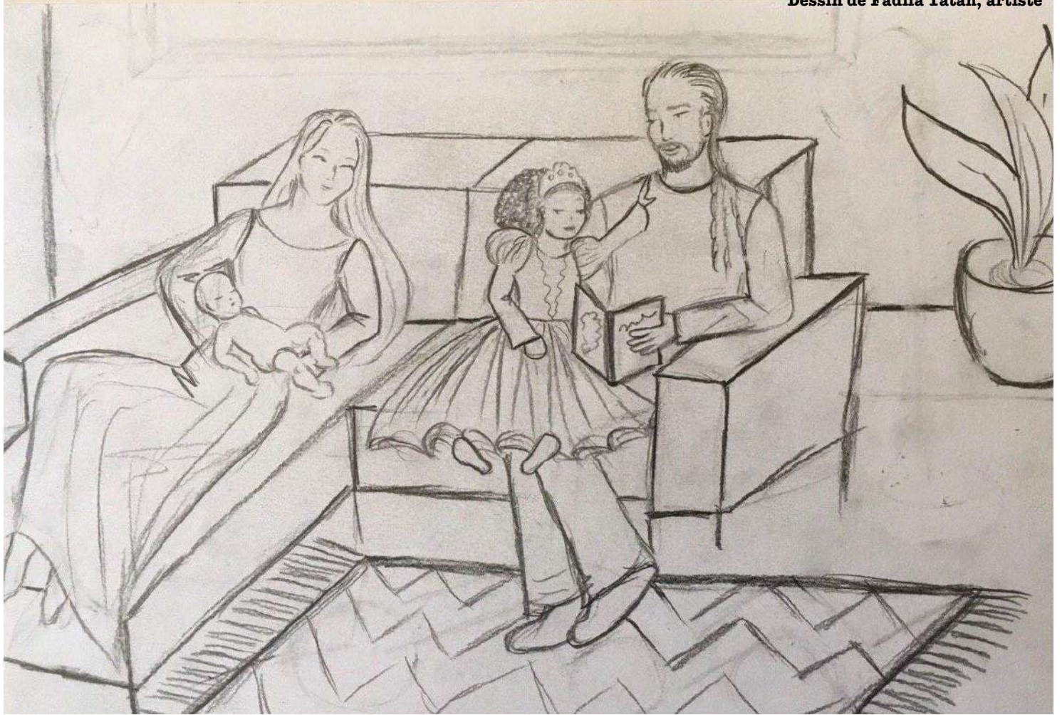
Dessin de Fadila Tatab, artiste